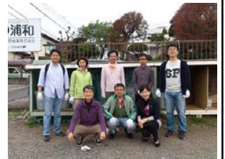
環境整備の後の爽やかな笑顔