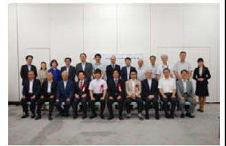
さいたまベンチャー社長塾入塾式