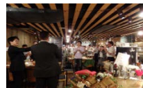
↑写真: 暑気払いの様子