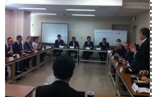
S V S 第4期生修了式