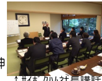
↑サ休 ハム社長講話