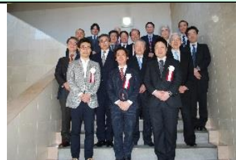
さいたまベンチャー社長塾 修了式の集合写真