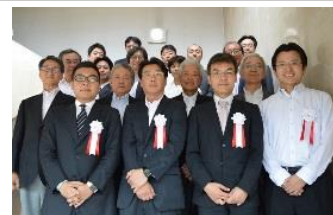
さいたまベンチャー社長塾 入塾式