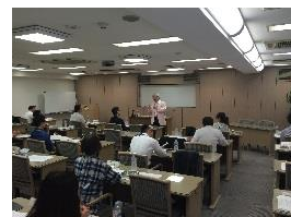
ベンチャー社長塾の様