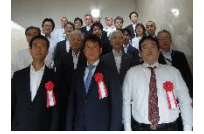
さいたまベンチャー社長塾入塾式