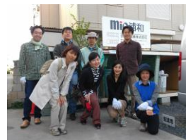
4/18の定例環境整備を終えて